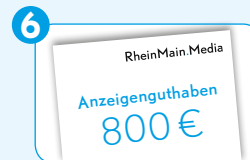
Händler erhält Information über Anzeigenguthaben (verfügbar bis 31.12.2020)