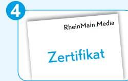
Käufer erhält ein Abhol-Zertifikat von RheinMain.Media