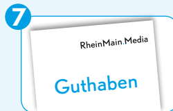
Bei Anzeigenbuchung erhalten Sie eine Rechnung, die Sie nicht bezahlen müssen. Diese wird mit Ihrem Auktionsguthaben verrechnet.